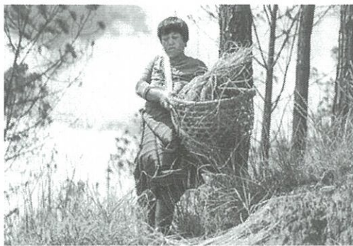
ブータン農家との接点を構築

日本で販売する際のブランド名はゾンカ語で「ブータンから（from BHUTAN）」を意味する「LAY BHUTAN」とする。バイオ・ブータンとの取引を通じ、今後同国で定温・冷蔵倉庫を運営していく際に、農家との接点をつくり、将来的にはブータン産農産物の流通加工、輸出につなげていく。