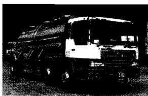
写真1 チョコレート生地専用トラック

最近では流通加工のニーズが増えてきており、そうした対応も行っている。これはリードタイムの長い海外(とりわけヨーロッパ、インド、中国)からの輸入の増