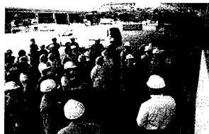
■写真-2 避難訓練の様子

図-3は昨年の10月頃に各事業所長を集めてディスカッションした際の資料である。このときは、「7月22日(日)午前10時に地震が発生、併せて、事業所、倉庫の所在地が停電(復旧見込みは不明の段階)の事態となった。責任者は家